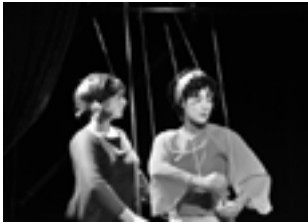
Ne Dormir Que d'Un Fil, 2003