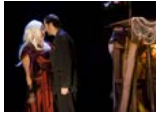
Avec moi le déluge, 2007