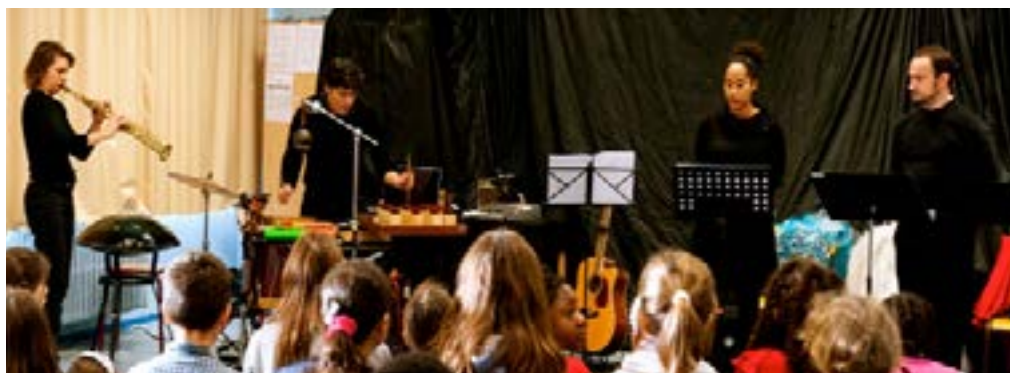
Lecture-spectacle dans une école de Massy, 2015

Notre objectif est de partager avec les jeunes notre univers artistique et de le mettre au service du projet. Nous souhaitons leur faire découvrir ce qu'est un processus artistique : questions, tentatives, tâtonnements, interrogations, prise de risque : assumer un résultat.