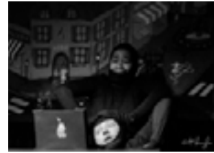
Bon an, Mal an, 2015